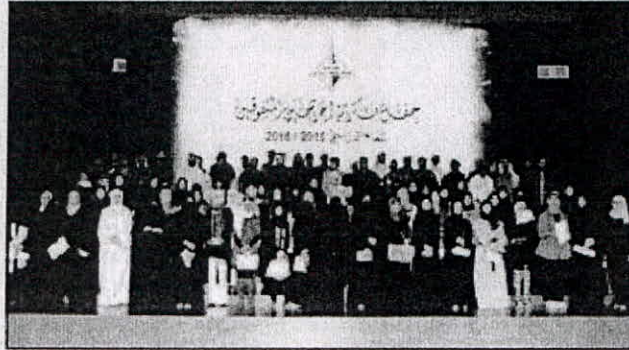
مناصب من البروفة

ما هي إلا فرق تطوعية من الهيئة تسعى لإنجاح حفل الخريجين المتفوقين وإخراجه بصورة لائقة أمام صاحب السمو الأمير. كما أكد المكيمي أن على الخريجين ضرورة الالتزام وحضور البروفة الأخيرة يوم الخميس الموافق 2017/3/9 حيث سيتم تسليم بطاقات الدعوة للخريجين. علماً أن موعد الحفل يوم الاثنين الموافق 2017/3/13 الساعة 10:30 صباحاً على أن يكون آخر الموعد لحضور الخريجين الساعة 8:30 والساعة 9:00 صباحاً لحضور أولياء الأمور.